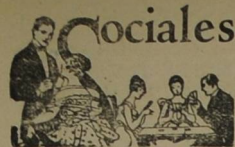
SANTA BARBARA, Julio 23—